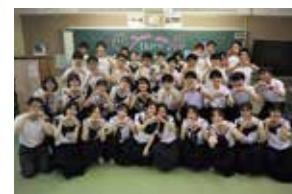
留学生との交流会