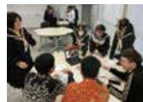
留学生との交流会 in 九工大